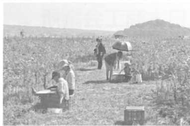
平成24年10月20日に開催した 「2012「空の日」フェスタ in NAGASAKI 「花のスケッチ大会」」の様様

この大きな大会を運営できたことは、かけがえの無い経験であり、皆様方のご協力のおかげと感謝しております。本当にありがとうございました。