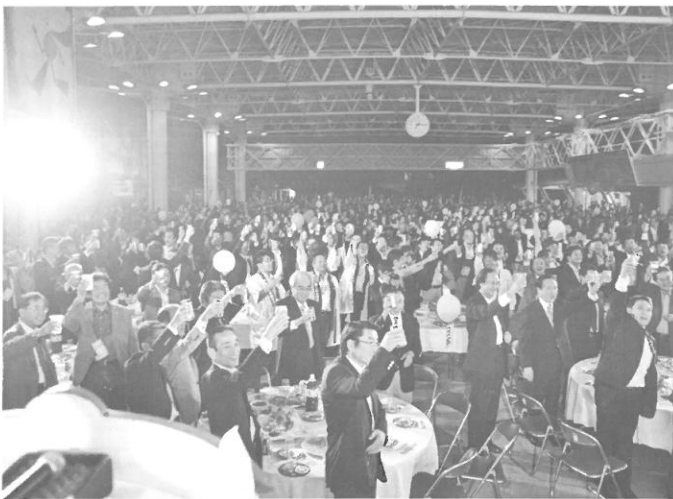
「第32回九州ブロック大会おおむらSTAGE」での懇親会の様様