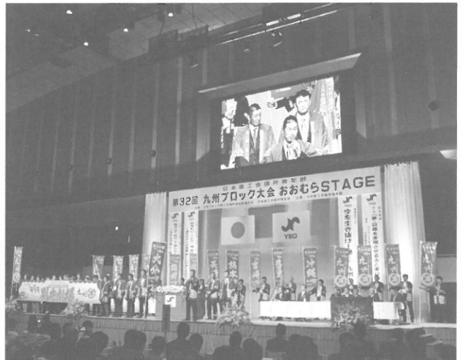
平成24年9月29日 「第32回九州ブロック大会おおむらSTAGE」での記念式典の様様

商工会議所の会員として、大村市民の1人として、大村市の未来に現実的な夢を描けた一年でした。