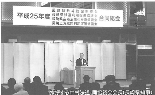
挨拶する中村法道・同協議会会長(長崎県知事)

議事では、(1)平成24年度事業報告及び収支決算について(2)平成25年度事業計画(案)及び収支予算(案)について(3)長崎新幹線建設期成会と長崎県鉄道利用促進協議会の合併について審議し、3議案とも承認されました。