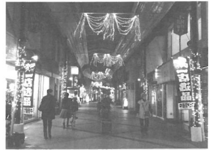
ライトアップされた下駅通りアーケード内の様子

大村市中央商店会の街なか魅力発信事業として今年から展開され、コレモ大村イベント広場～下駅通り商店街入口～本陣通り商店街入口までを煌びやかな光で彩ります。