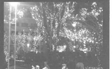
昨年の第2回「きらめく夜の散歩道」の様子