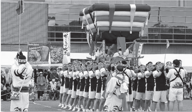
水主町コココデショ

11月8日に秋晴れの素晴らしい天候のもと、大盛況のうちに無事終了いたしました。 (来場者数約12,000名) 伝統的な催しと新たな企画を、多くの皆様の笑顔と共に成功裏 に終えることができました。ご来場いただいた市民の皆様、そしてご尽力いただいた全て の関係者へ心より感謝申し上げます。