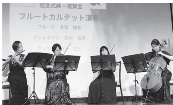
フルートカルテットの演奏の様子