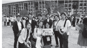
Expo2025大阪関西万博会場にて