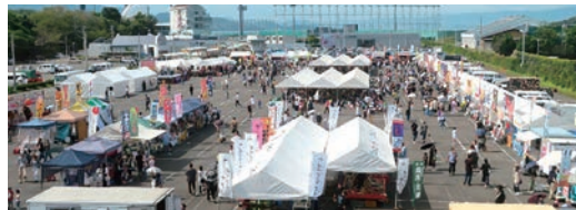
令和6年のグルメフェアの様子