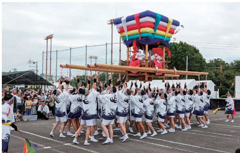
水主町コッコデショ

ご家族、ご友人と、心ゆくまでお楽しみください! 皆様のご来場を心よりお待ちしております。