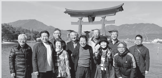
集合写真(厳島神社)