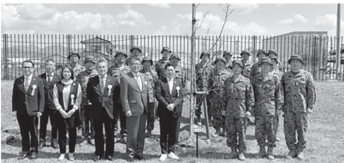
第三水陸機動連隊員との記念撮影