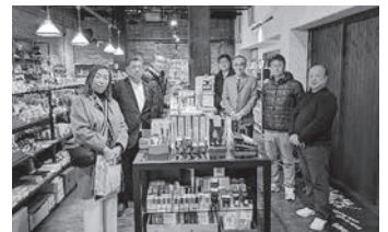
ナガサワ文具センターでの集合写真