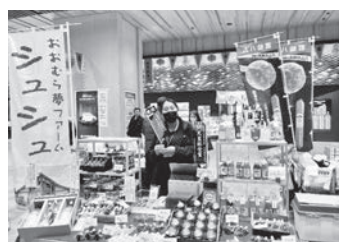
「長崎よかもん物産展」会場