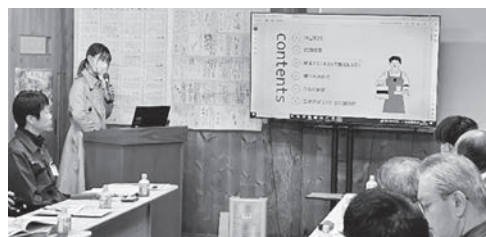
プリン専門店mojito様事例発表