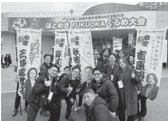
大会会場入り口にて

くるめ大会では、記念行事として令和6年度卒業予定者の卒業式が行われました。卒業式が進んでいく中、スペシャルゲストが登場した際には会場内が大きな盛り上がりを見せました。大懇親会は久留米アリーナを貸切の状態で開催し、全国各地から集まった青年部の方々と交流・研鑽を行いました。