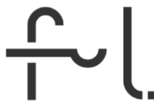
TABLE & IDEA