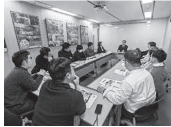
長崎ソウル事務所にて意見交換会(2日目)