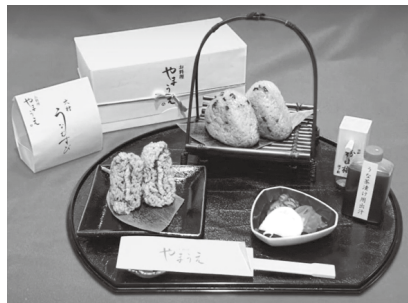
第10回 最優秀グランプリ受賞 「大村うなむすび」

第11回目となる今回は、令和5年10月28日(土)に出品商品の市民審査・専門審査を行い、最優秀グランプリ1品・準グランプリ1品・優秀賞1品・お土産賞(仮称)1品を選びます。