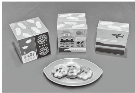
第10回 新幹線お土産賞受賞 「おおむらこつぶピーナッツ ひらいてくっきー」