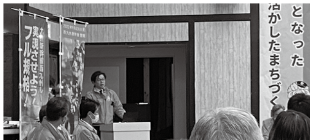
登壇する当所時副会頭

要望内容は、①一般国道34号大村諫早拡幅の整備促進、②一般国道34号大村拡幅の整備促進、③桜馬場交差点・池田2丁目交差点及び空港北口交差点の渋滞対策、④長崎空港連絡道路（構想路線）の研究の4点で、市内幹線道路の整備は県央地域の経済活性化と国土強靱化に必要不可欠である点を強調しました。