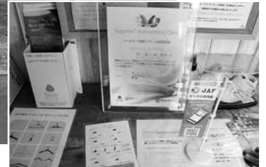
▲県内でも希少なラグーン技術認定店