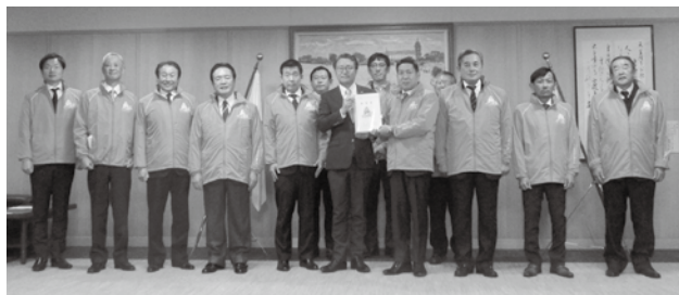
大石県知事に要望書をお渡しする協議会の皆様