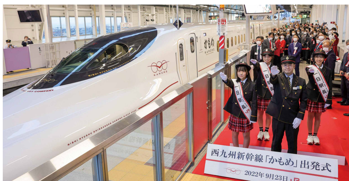
西九州新幹線「かもめ」出発式 2022年9月23日

決定しました。これは、地域の大きな誇りであり、伝統芸能の継承に引き続き支援して参ります。 以上、昨年の実績を踏まえ、本年も会議所の使命である、地域経済の活性化のために会員への更なる支援事業と、市民の皆様に関与するような事業の展開を、役員・議員が一丸となり取り組んで参りたいと思っております。 何卒本年もよろしくお願ひ申し上げます。