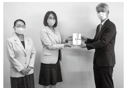
義援金贈呈で県庁を訪問