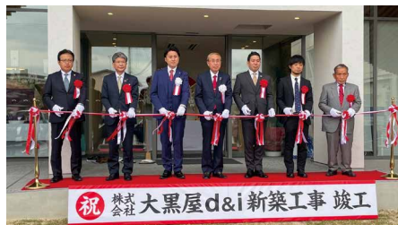
オープニングセレモニーでのテープカット