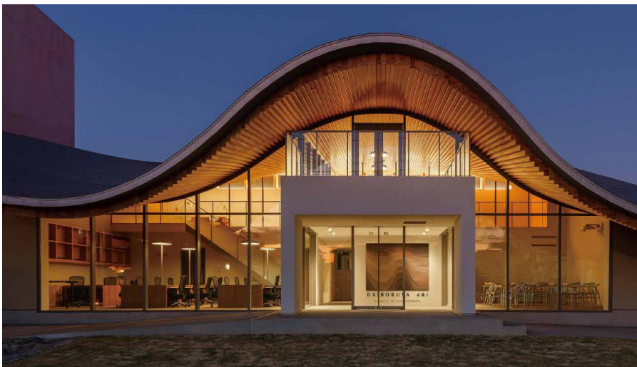
昼と夜で違う顔を見せるd&i