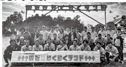
一人一花運動推進事業「のだけわくわくランド」

大村商工会議所青年部（大村YEG）は本年、第22回おおむら秋まつりで「ダンスフェスティバル2022」（11月13日）を、ロザ・モタ広場にて一人一花運動推進事業「のだけわくわくランド」（11月20日）を開催しました。多数のご来場、誠にありがとうございました。