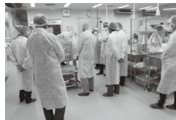
設備を視察する食品部会の皆様

食品部会では11月14日、長崎県産品を活用した加工食品の高付加価値化を推進する目的で長崎県工業技術センター（大村市池田2丁目）内に開設された「食品開発支援センター」を視察。