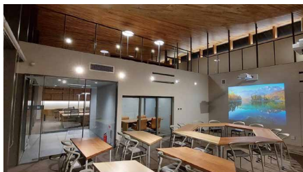
最新のOA機器が導入された新社屋