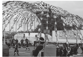
伝統芸能は「黒丸踊」を披露